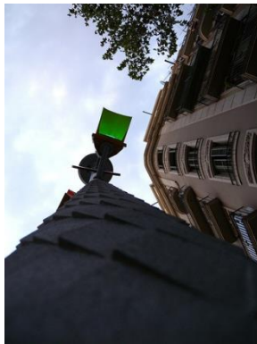
Figura 5. Semàfor en verd.

S'ha de posar la nota al peu de la figura en un cos de lletra més petit.